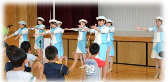
はちこのテーマソングを 皆で歌って踊りました♪