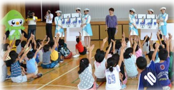
バスの乗り方を クイズでお勉強★