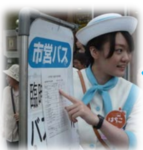
『八日町』臨時バス停のご案内