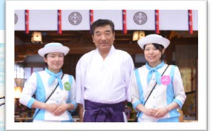
蕪嶋神社の宮司さんと記念撮影♥