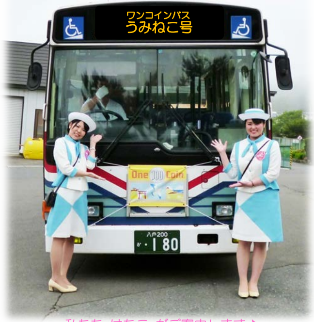
私たち はちこ がご案内します♪