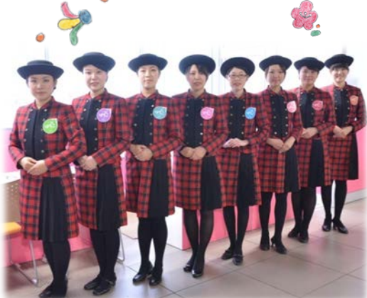
今年もよろしくお願ひいたします♪

二〇一四年がスタートしました！昨年五月からハ戸駅での案内業務を開始して八カ月が経過しました。本年も皆さまのご理解とご協力をいただきながら、案内業務に努めてまいります。