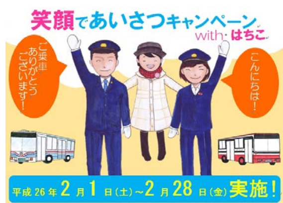
にこにこ笑顔あふれる ハ戸のバス♪

二月一日(土)から二月二十八日(金)までの一ヶ月間、接客サービスの向上と日頃のお客様への感謝を表すため「笑顔であいさつキャンペーン with はちこ」を実施いたします。