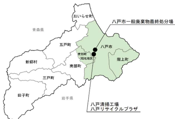
図1 八戸地域広域市町村圏事務組合の範囲と建設候補地選定エリア（緑）

この選定に併せて、市民の皆様からの建設候補地の提案を募集いたしますので、以下のとおり建設候補地の公募説明会と選定状況の報告会を実施します。