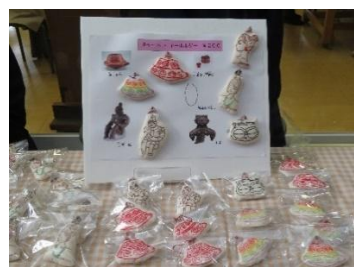
千葉学園高等学校