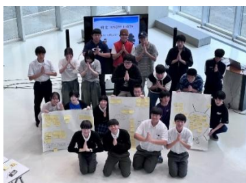
八戸工業大学第二高等学校