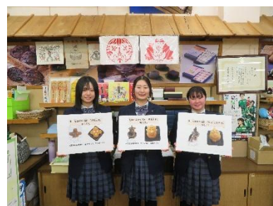
千葉学園高等学校