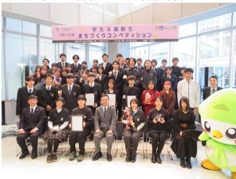
学生 & 高校生まちづくりコンペティション（活動成果発表会）の様子