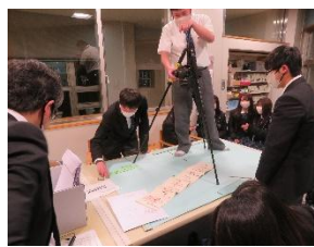
八戸工業大学第二高等学校