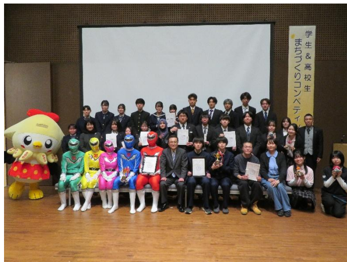
学生 & 高校生まちづくりコンペティション（活動成果発表会）の様子