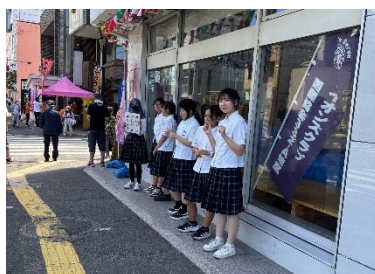
八戸工業大学第二高等学校