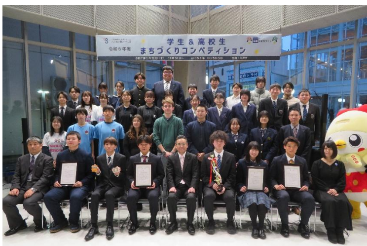
学生＆高校生まちづくりコンペティション（活動成果発表会）の様子