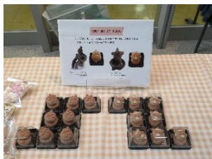
千葉学園高等学校