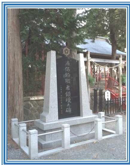
< 消防殉職者鎮魂之碑：おがみ神社 >