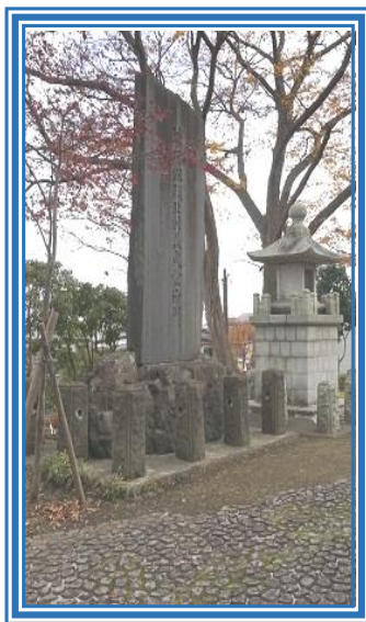
< 消防組北村益氏景仰碑：三八城公園 >

また、消防記念日と併せて消防殉職・物故者慰霊祭を実施しており、団長以下現役の幹部団員が、 おがみ 霧神社にある「消防殉職者鎮魂之碑」と三八城公園内にある「消防組北村益氏景仰碑」に拝礼している。