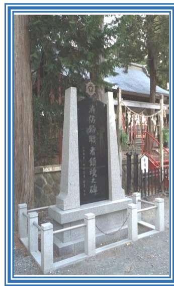
< 消防殉職者鎮魂之碑：法靈山 霧神社 >