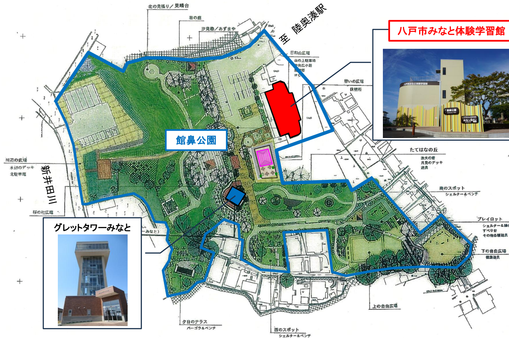
八戸市みなと体験学習館