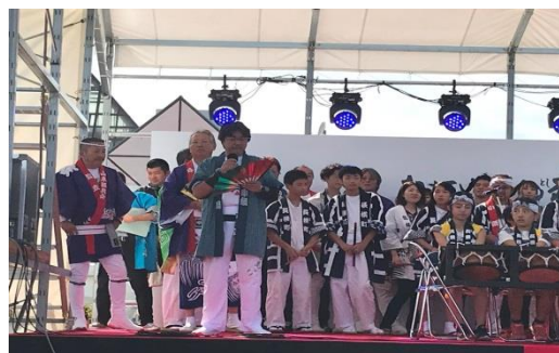
お祭りステージ(八戸三社大祭囃子)