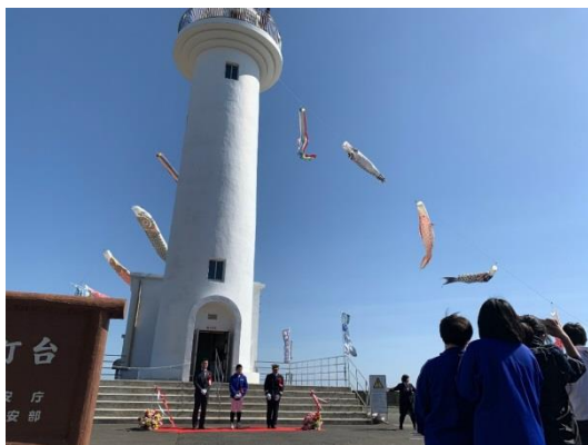
オープニングセレモニー(4/20)