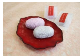
特撰紅白ミニ鶴子まんじゅう 6個入りセット