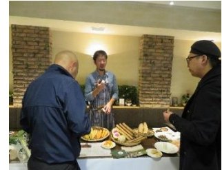
11/30 首都圏プロモーションの様子

(1)で輸送した食材を活用、かつ地場産品生産者も同行し、飲食店シェフに対し、地場産品の試食及び商材紹介を行い認知度向上等につなげる対応実施