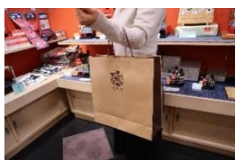
ローカルマーケット ショッピングバッグ紙袋

はちのへローカルマーケットショッピングバッグ等及びコンベンションバッグデザイン変更