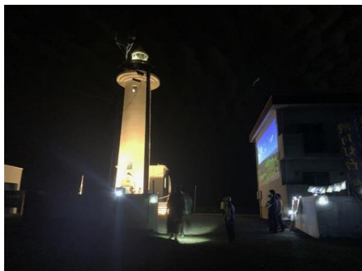
夜間開放(8/24の様子) 9/14・21も実施