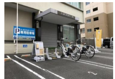
青い森信金本店営業部の ポート設置場所(グランドホテル側)