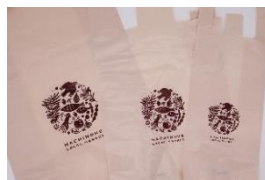
ローカルマーケット ショッピングバッグ:ビニール