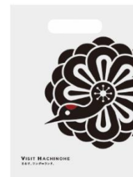
コンベンション バッグ デザイン