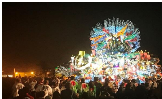
お祭りパレード(八戸三社大祭)