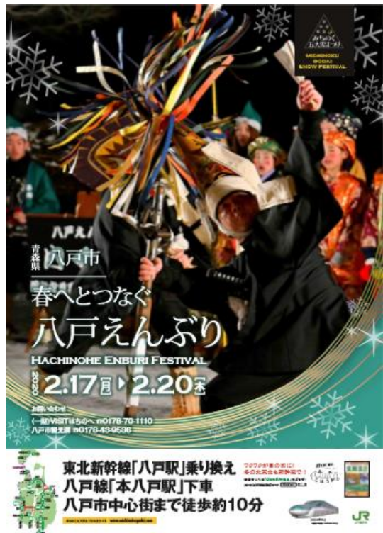
みちのく五大雪まつり推進協議会製作