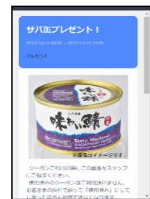
VISIT公式LINE クーポン発行 画面サンプル