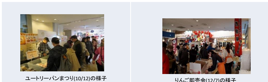
ユートリーパンまつり(10/12)の様子