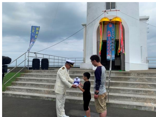
2019年来場者1万人セレモニー(9/15)