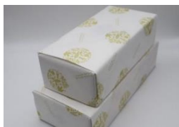
ローカルマーケット 包装紙