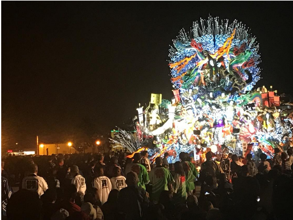
あおもり10市大祭典inつがる パレードの様子(令和元年9月21日)