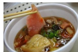
南部せんべい【ことぶき】で作った 八戸せんべい汁