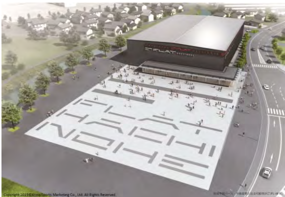
パース1 フラットアリーナ外観①