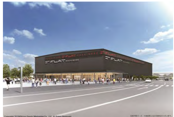
パース2 フラットアリーナ外観②