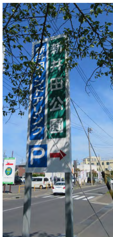
公園の正面の入口看板