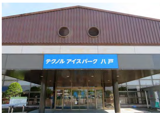
新井田インドアリンク入口看板