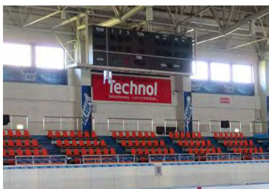
特典等の2 リンク内壁面への企業名の表示