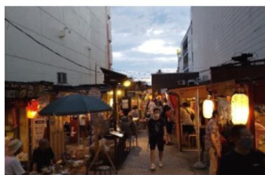
夕方から大勢の人で賑わう みろく横丁