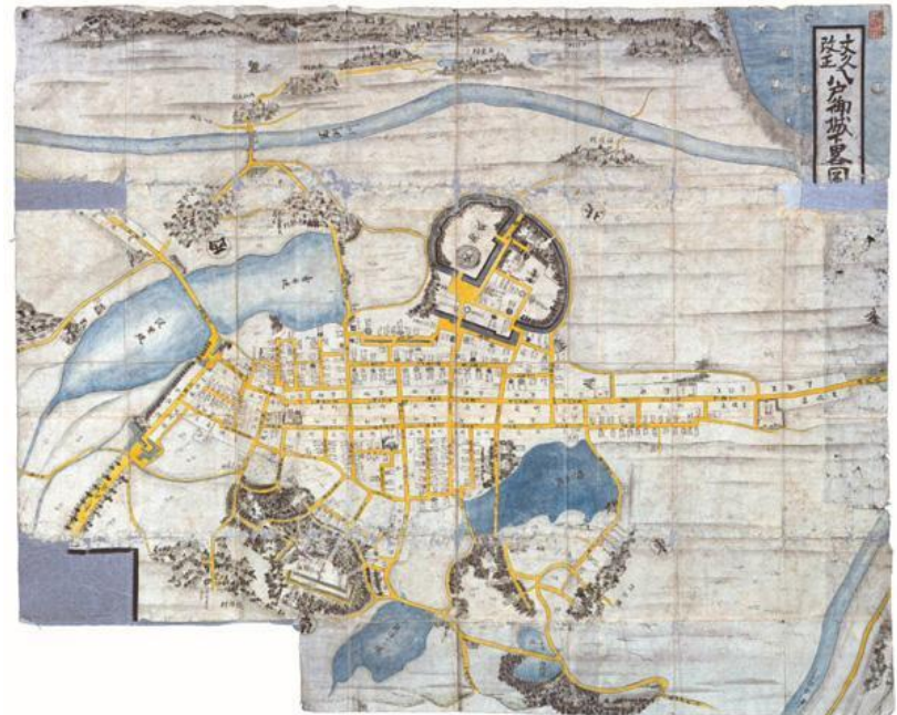
文久改正八戸御城下略図(八戸市立図書館蔵)

言うまでもなく、街をつくるのは“人”です。歴史を繋ぎながら変化を重ね、今に至る八戸の中心市街地の再生を目指し、そして価値ある資産としてしっかりと次世代に引き継いでいけるよう、概ね10年を目安とするまちづくりの指針となる「まちづくりビジョン」を作成します。私たち市民や民間事業者など、多様な主体が将来のビジョンを共有し、連携を深めながら様々な課題に立ち向かい、まちづくりに取り組んで参りましょう。