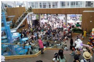
はちのへほコテンで賑わうマチニワ