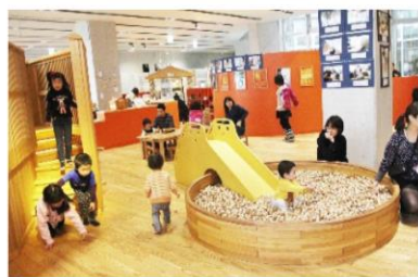
「こどもはっち」で遊ぶ親子連れ