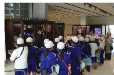
「はっち」でボランティアガイドから 八戸の魅力を学ぶ小学生