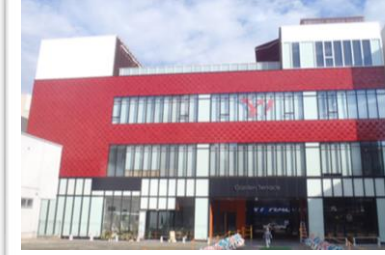
IT企業が入居する再開発ビル