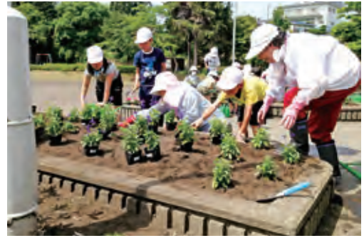
地域密着型教育推進事業

保護者と地域住民の学校運営への参画を促進し、開かれた学校づくりに取り組むとともに、地域の人材を活用して教育活動の一層の充実を図ります。