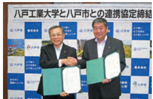
八戸工業大学との連携協定締結

奨学金制度により高校生や大学生の就学を支援するとともに、地域振興と地域人材の育成に向けた大学等との連携を推進します。