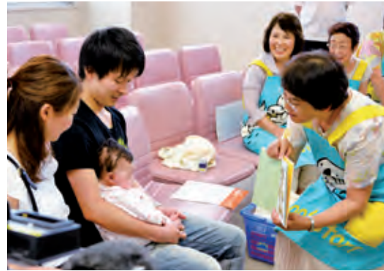
八戸市ブックスタート事業