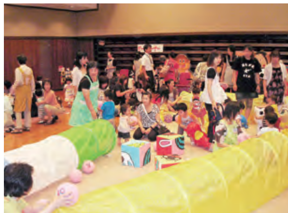
子育てサロン事業