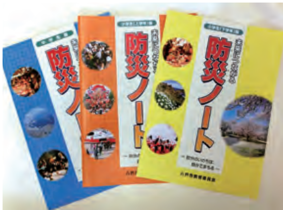
防災ノート活用事業

災害に強い都市基盤の整備を図るため、災害時に避難所となる避難施設の整備や、津波災害時における避難道路等の整備を進めるとともに、急傾斜地や河川、海岸等の防災対策を促進します。