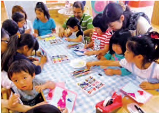
「こどもはっち」で遊ぶこどもたち