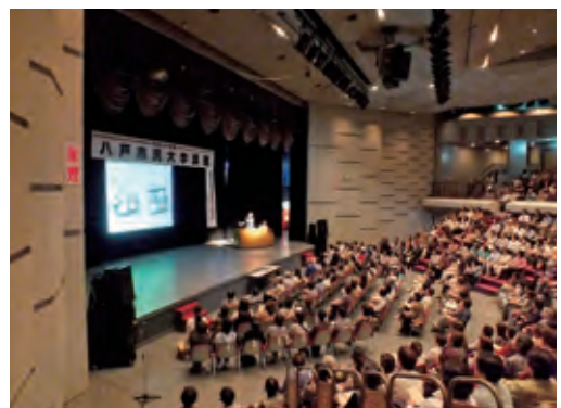
八戸市民大学講座

社会教育の充実を図るため、多様な学習機会の提供や地区公民館の整備を進めるとともに、家庭・地域の教育力の充実を促進します。