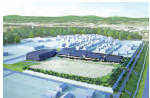
西白山台小学校（完成予想図）

就学前の幼児期に豊かな人間性を育むため、就学相談や私立幼稚園への支援に取り組むとともに、幼稚園・認定こども園・保育所（園）・小学校の連携の推進により、就学前教育から小学校教育への円滑な接続を図ります。