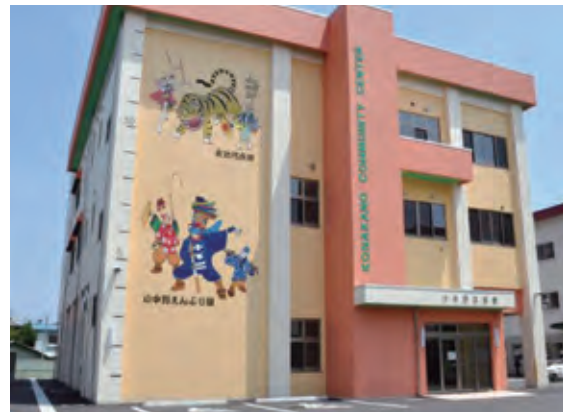
津波避難機能を有する小中野公民館