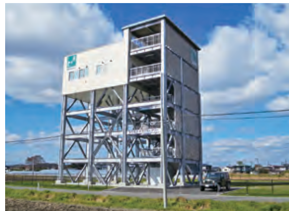
多賀地区津波避難タワー