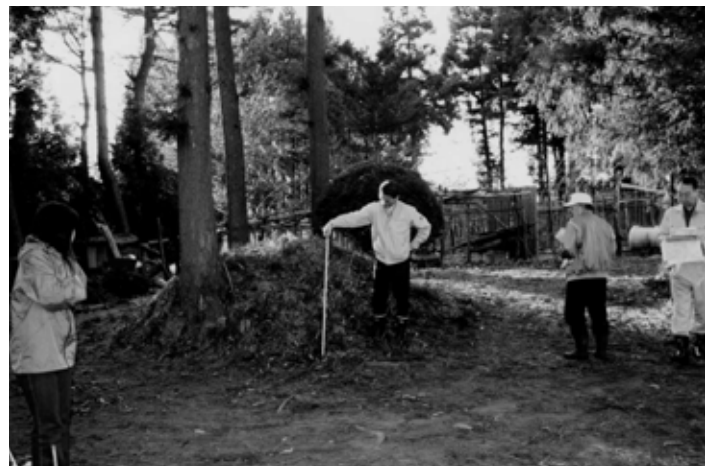
七崎と上市川の境にある郷境塚