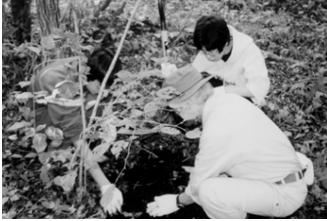
動物調査の風景（9月）

また現在、市内各地区で動植物の生息調査や地質調査などを実施しており、興味深いものが見つかっています。