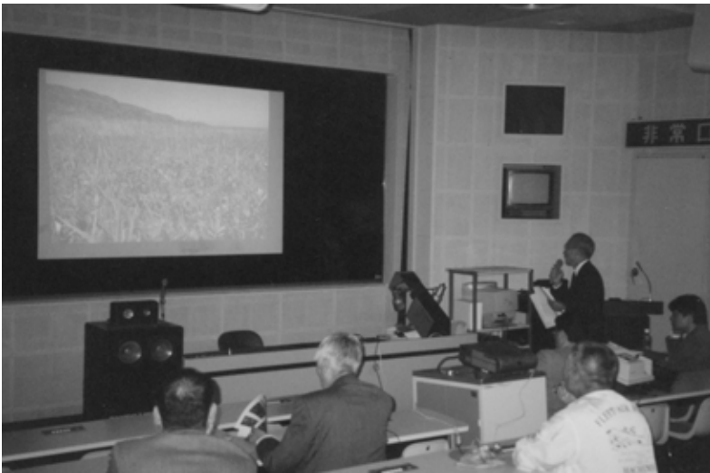
発表会の情景 映像を交えて成果発表する調査員

平成13年9月、自然編におけるこれまでの調査成果の第1回発表会が八戸市児童科学館で行われました。