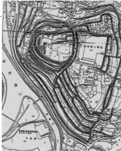
新田城の縄張り図

もと、パワフルに野山を駆けめぐり、新田（新井田）城、櫛引城、風張館の3ヶ所の現況を調査しました。そして左図のような縄張り図を各城館ごとに作成し、現在、その範囲確定の作業を進めています。