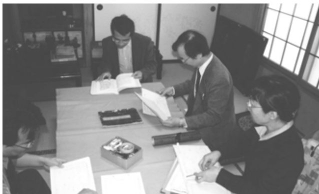
新井田家資料調査（福島市・新田家）

切な仕事です。しかしそれだけではなく、資料を保存し、後の世代に残していくことも私たちの重要な仕事です。資料を見せて下さるのは侍や商人の子孫の方が多いようです。その反面、特に農業や漁業関係の資料がなかなか集まらないのが悩みです。古い資料は墨で草書体で書かれていて読みにくいので、ややもすれば忘れられ、最後には紙くずとして処分されてしまうようです。処分する前にぜひ私たちに連絡を下さい。