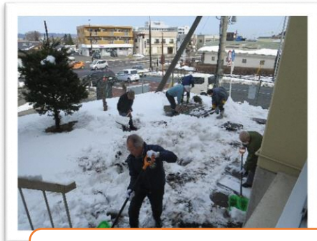
非常階段からの通路の除雪、 ありがとうございました♡