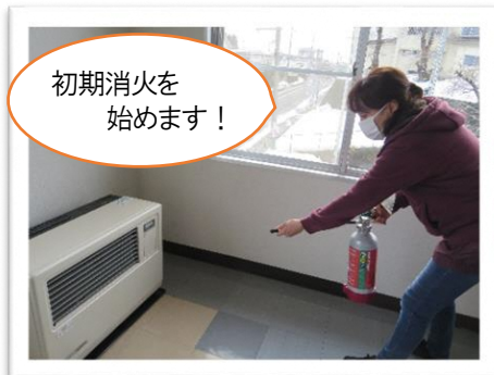
初期消火を 始めます！