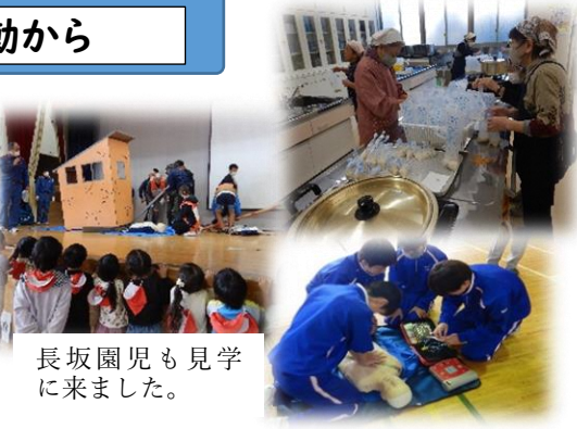
長坂園児も見学に来ました。

<防災訓練> 10月7日(土)根城中学校体育館を会場に町内会・小、中学生・関係者が参加して、根城地区連合町内会自主防災会による防災訓練が実施されました。朝7時、女性部による公民館と根城中での炊き出しから始まり、消防署根城分遣所の指導のもと、ダンボールを利用しての居住空間作成や、倒壊家屋からの救出、AEDを使用したの心肺蘇生など、11時半まで多くの訓練を行いました。