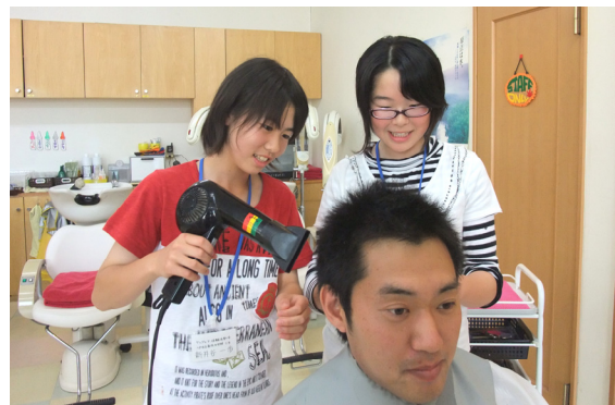
[写真は、明治中と南浜中の今年度の活動のようすです]