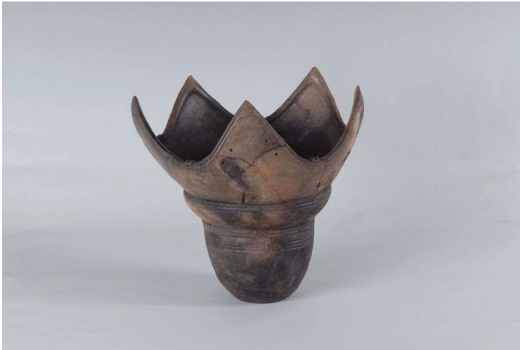
当該資料 高さ 32cm