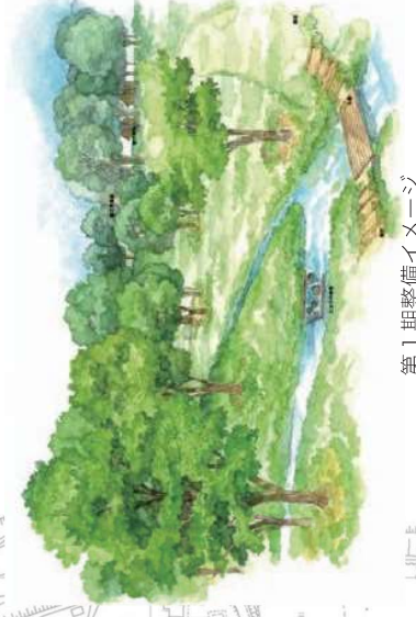
第1期整備イメージ