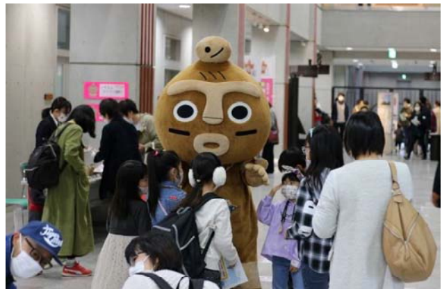
▲大人気の「いのるん」も登場！