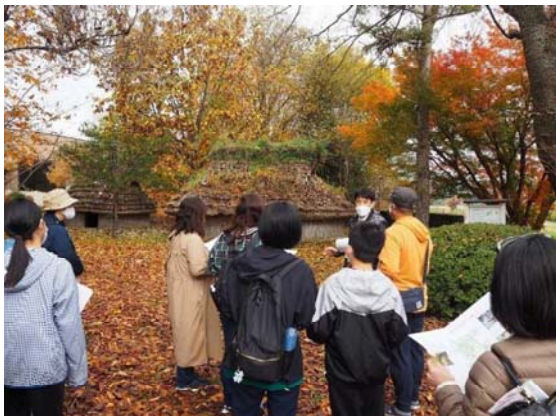
▲学芸員と遺跡ツアーの様子