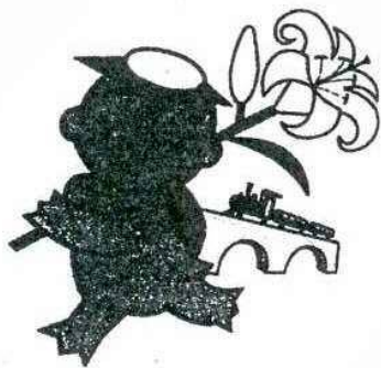
遠野市公式キャラクター「カリンちゃん」