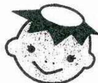
遠野くるりん号イメージキャラクター「くるりんちゃん」