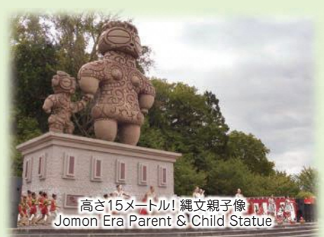
高さ15メートル! 縄文親子像 Jomon Era Parent & Child Statue