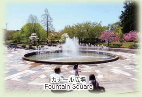
カナル広場 Fountain Square