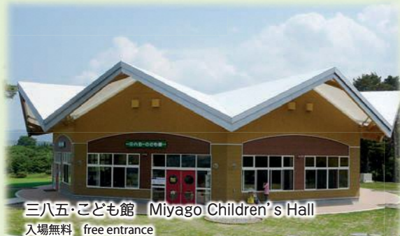
三八五・こども館 Miyago Children's Hall 入場無料 free entrance