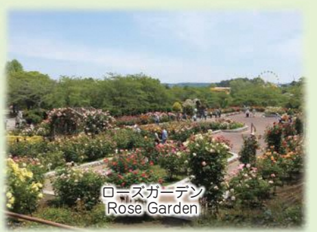
ローズガーデン Rose Garden