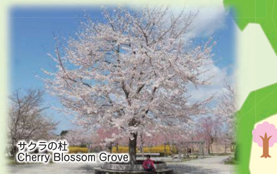
サクラの杜 Cherry Blossom Grove