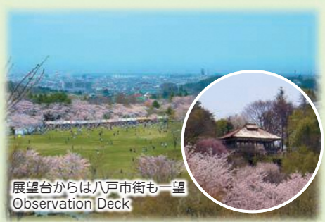
展望台からは八戸市街も一望 Observation Deck