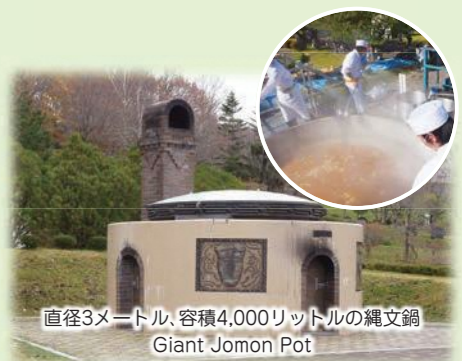
直径3メートル、容積4,000リットルの縄文鍋 Giant Jomon Pot