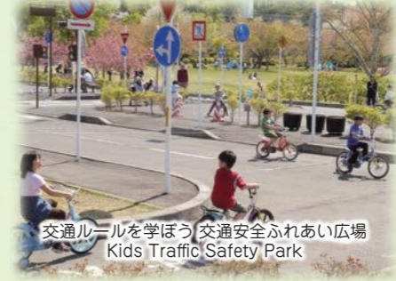
交通ルールを学ぼう! 交通安全ふれあい広場 Kids Traffic Safety Park