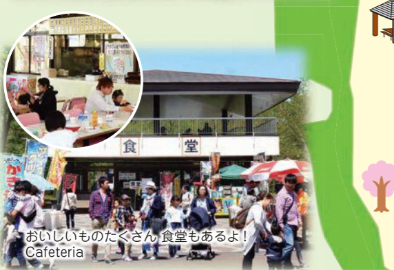
おいしいものたくさん 食堂もあるよ! Cafeteria