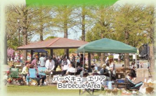
バーベキューエリア Barbecue Area