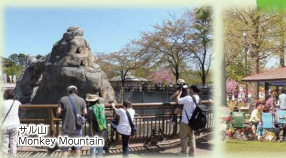
サル山 Monkey Mountain