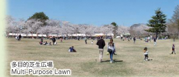
多目的芝生広場 Multi-Purpose Lawn