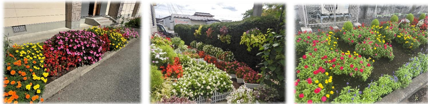
※写真は令和7年度の入賞作品