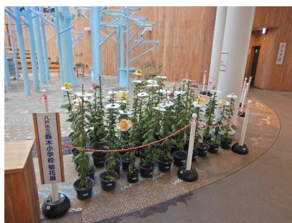
第51回はちのへ菊まつり（令和4年度開催）での展示