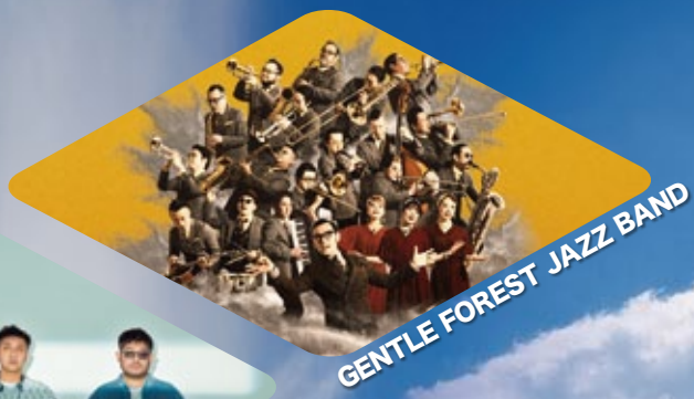
GENTLE FOREST JAZZ BAND