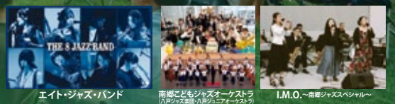
エイト・ジャズ・バンド 南郷こどもジャズオーケストラ I.M.O. ~南郷ジャズスペシャル~

◆チケット(税込) 一般/前売 7,500円 (当日: 8,500円) ペア/前売 14,000円 高校生以下 無料