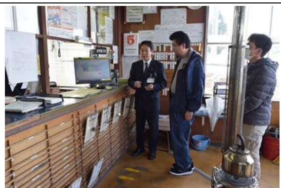
写真2 アルコールチェックを体験する様子