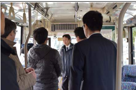
写真4 路線バスの車内で説明を受ける様子