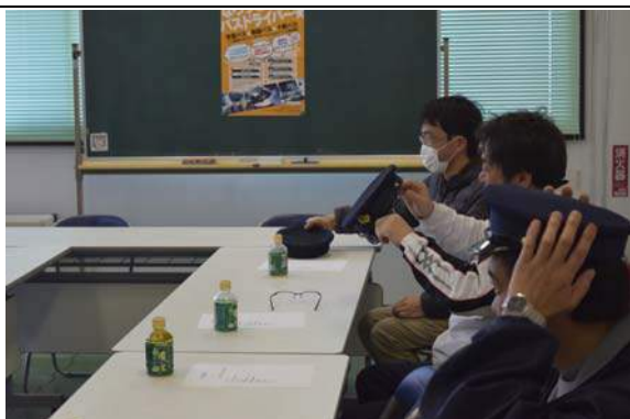
写真1 制帽を体験する様子