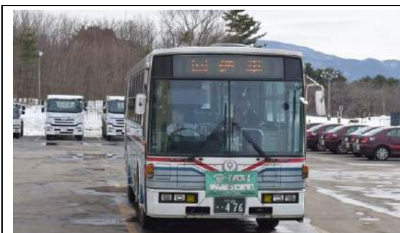
写真 3 路線バスの運転体験の様子