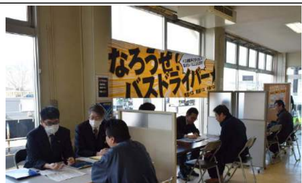
写真 2 お仕事説明の様子