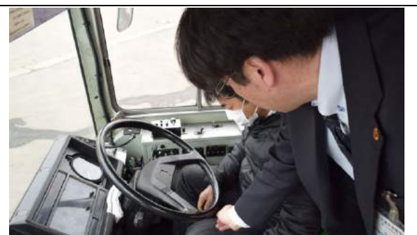
写真 4 路線バスの運転体験の車内での様子