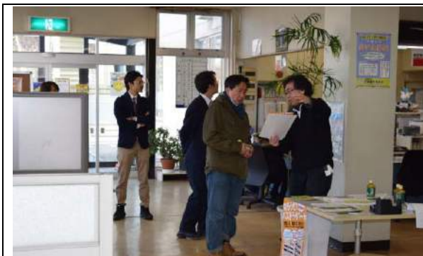
写真 1 受付の様子