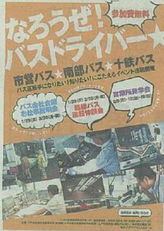
初めて開催される「なろうぜ! バスドライバー」のポスター

不足しているバス運転手を確保しようと、八戸市地域公共交通会議(事務局・市都市政策課)などは29日の路線バス運転体験会を皮切りに3月にかけて「なろうぜ! バスドライバー」と題したイベントを展開する。地域の公共交通の根幹をなす路線バスを維持し、地域住民の足を守るのが狙い。ほかにバス会社の合同仕事説明会、営業所見学会を開催する。(岩村史生)