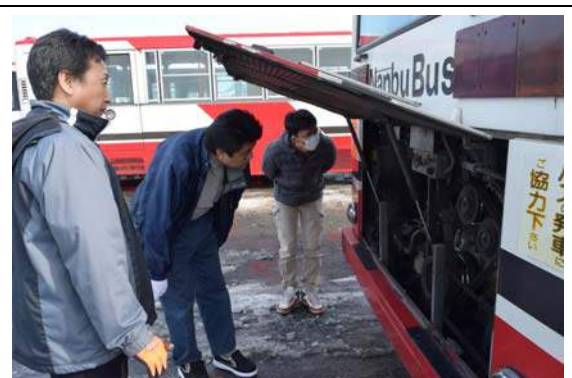
写真3 車両を点検する様子