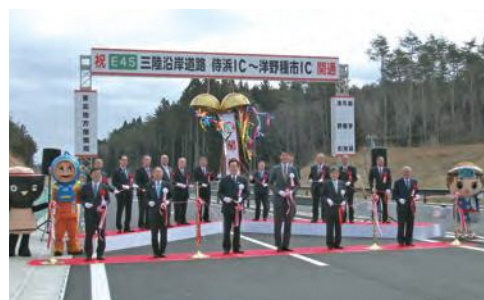
▲R3.3.20 洋野階上道路(侍浜IC～洋野種市IC)開通式典