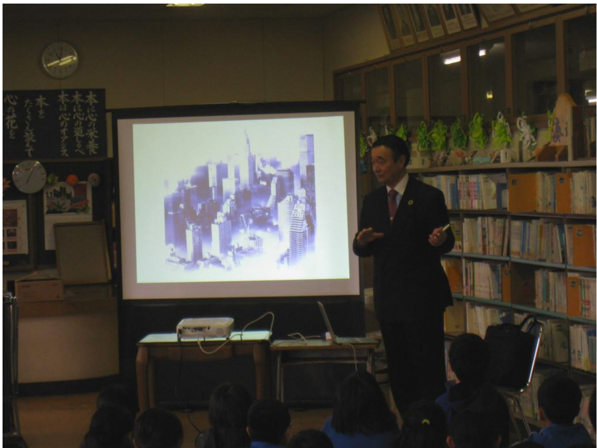
抗生物質と薬剤耐性菌について、小学生にはイラストを用いて分かりやすく説明しています。