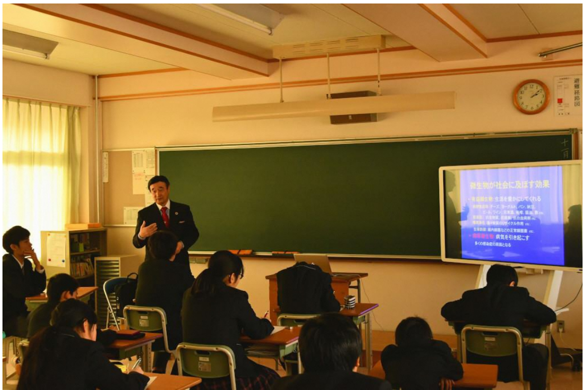
1年間に世界中で細菌による犠牲者が何人いるか野田先生から生徒に質問。