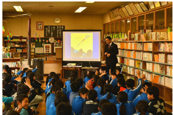
講演終了後は、生徒代表からお礼の言葉。