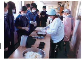
防災訓練での炊き出しの様子 【根城地区連合町内会 女性部会】 岡根城公民館 44-6927

部会が発足して間もなく、根城地区防災訓練での炊き出しや根城公民館文化祭での食堂運営などの大役を担うことになりましたが、一致団結してスムーズに行うことができました。大人数がまとまるには大変なこともありますが、みんなでやり遂げた充実感も得られます。自分とは違った調理法との出会いなど新たな知識を得られる場面もあり、活動する楽しみの一つとなっています。新生「女性部会」は、地域にとって無くてはならない存在となるよう、これからも活動を続けていきたいと思っています。