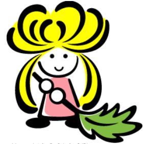
八戸市環境美化協議会キャラクター 美化ちゃん