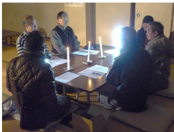
H28.1.30 柏崎地区連合町内会自主防災会 防災訓練(宿泊)