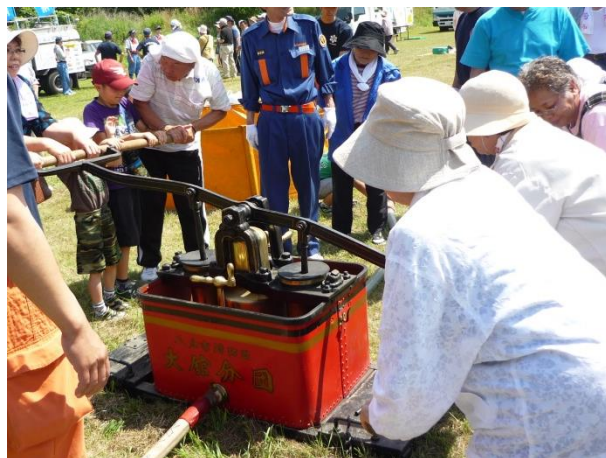
H27.7.12 IS(岩淵・塩入)自主防災・防犯会 防災訓練