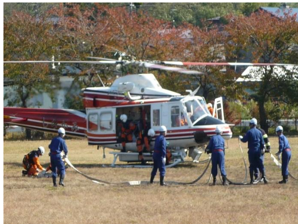
H27.10.18 島守地区総合防災訓練