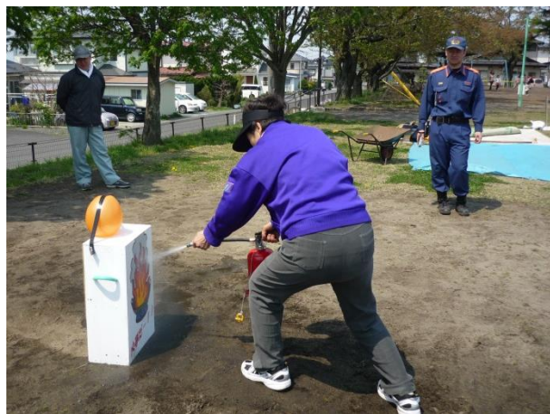
H27.4.29 白銀台六丁目町内会自主防災会 防災訓練