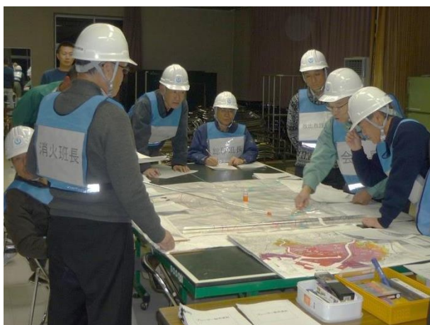
H27.12.9 大館地区自主防災会研修会