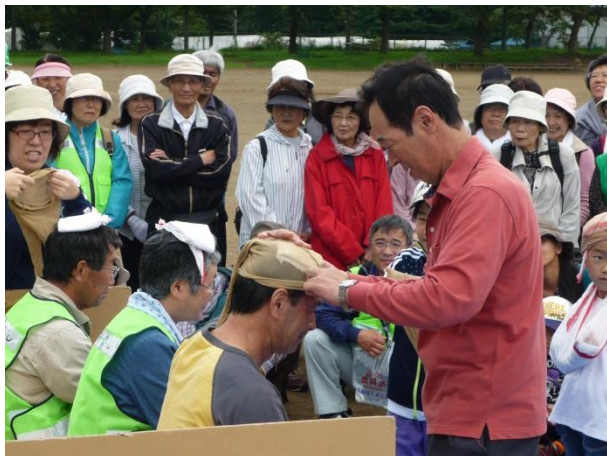
H27.9.20 アスネット根岸自主防災会訓練