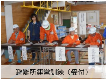
避難所運営訓練（受付）

地元である上長地区自主防災会が参加し、避難誘導訓練、避難所運営訓練（受付・避難所運営会議）、炊き出し訓練を実施しました。