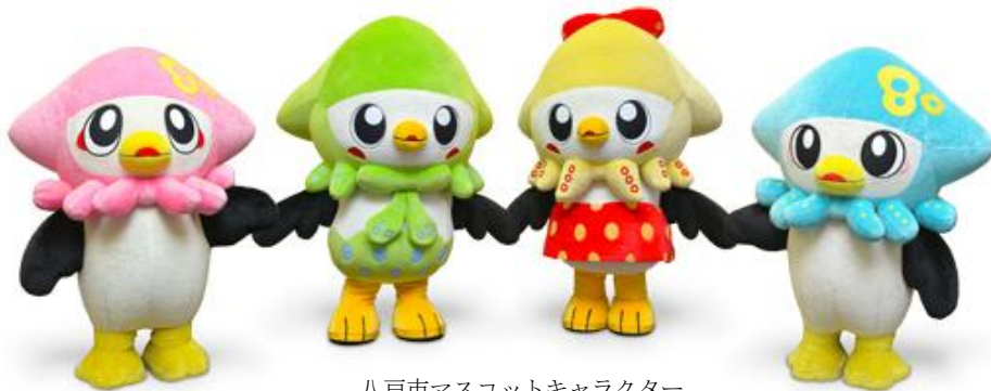
八戸市マスコットキャラクター いかずきんズ