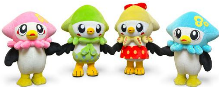
八戸市マスコットキャラクター いかずきんズ