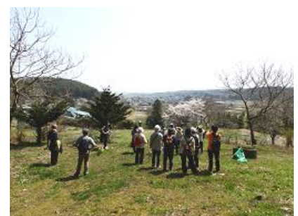
◆ ウォークラリー ◆

今後も豊崎の魅力を発信していけるよう力を合わせて活動を続けていきたいと思ひます。