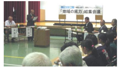
◆ 結集会議 ◆

豊崎地域は、川と緑に囲まれた美しいまちで、数多くの歴史や伝説が残されています。しかし最近では、地域の財産とも言える豊崎の歴史、文化を知らない子どもたちが増えています。子どもたちをはじめ、豊崎に暮らす誰もが、そこに息づく歴史や文化に触れ、学ぶことができるように、マップ作成に取り組むことになりました。