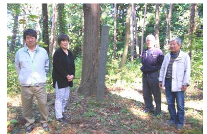
◆ 調査のようす ◆

現地確認や調査は、メンバーの一人ひとりが手分けして現地に足を運びました。同時に他県の図書館にも出向くなど資料の精査を行い、掲載文章の執筆を進めました。資料収集、精査からマップ原案づくりまで、9 か月間にわたり調査・校正を繰り返しました。その後、業者のゲラ刷りについても、5 か月近くの時間をかけ、内容を練り上げていきました。