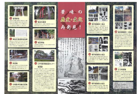
◆ マップパンフレット ◆

念願のマップパンフレットが完成すると、早速マップを活用し、小学校で児童対象の歴史・文化講座、続いて、地域住民を対象にした歴史講座を瑞豊館で開催しました。大人も子どもも身を乗り出して話を聞いてくれるほど、大変好評でした。