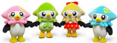
八戸市マスコットキャラクター いかずきんズ

八戸市では、男女共同参画社会実現のために、平成 13 (2001) 年 6 月、市議会において「男女共同参画都市宣言に関する決議」を全会一致で採択し、同年 10 月に「八戸市男女共同参画基本条例」を施行しました。