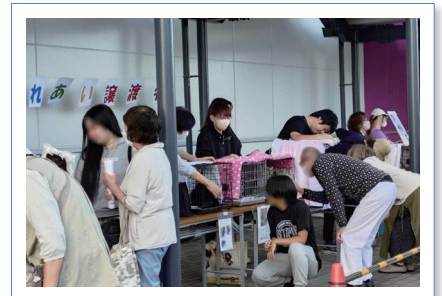
毎月第1・第3(日)に譲渡会を開催しています

会員同士でもプライベートのことを話しません。また、会の活動をしていることを外で言わないようにしています。