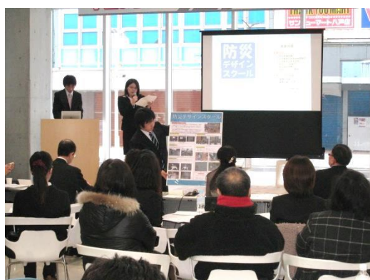
H24 年度学生まちづくり・コンペティションの様子