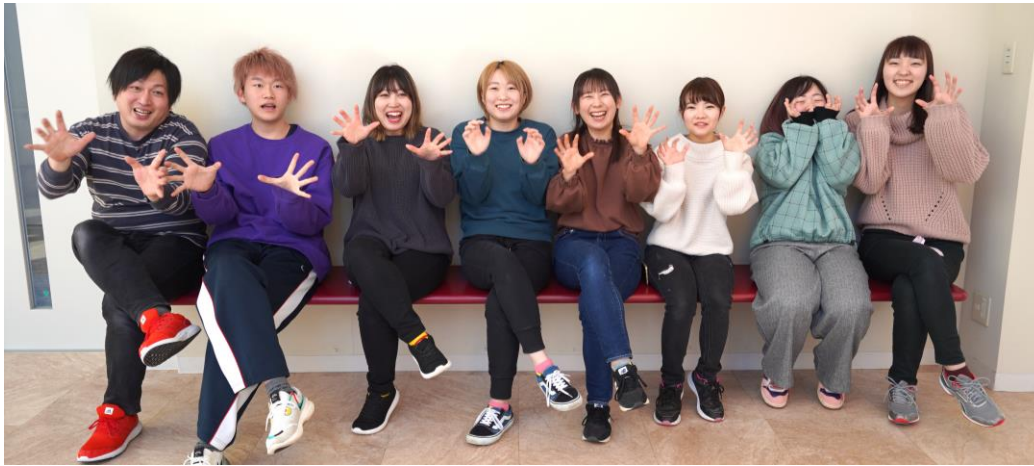
読み聞かせサークルのメンバーたち（2年生）