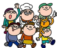
市民の皆さん (提案者)

まちづくりや地域課題の解決のため、市民の皆さん（提案者）と市（行政）が協働して取り組むことにより相乗効果が期待できる事業の提案を募集します。