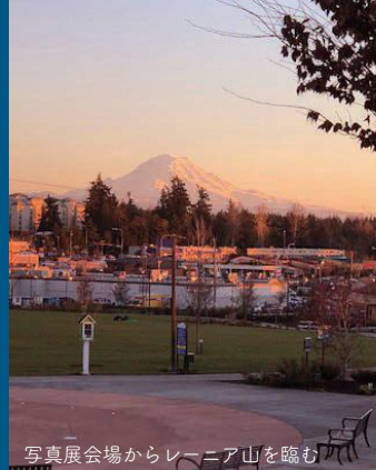
写真展会場からレーニア山を臨む

八戸市民の手による写真を通して、八戸の魅力を再発見し、また、フェデラルウェイ市への親しみを深めていただければ幸いです。