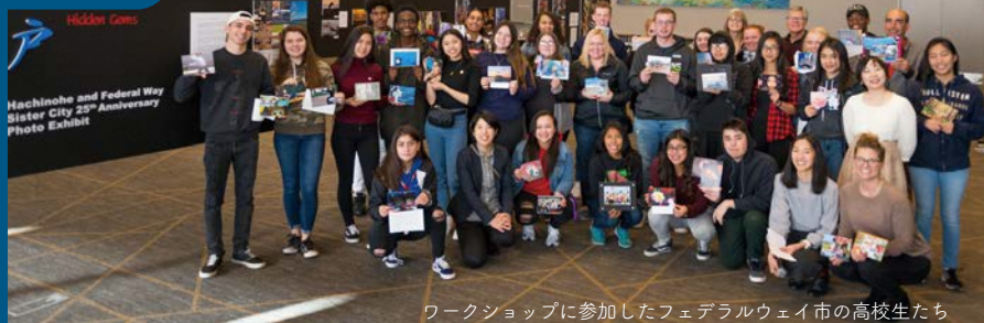
ワークショップに参加したフェデラルウェイ市の高校生たち