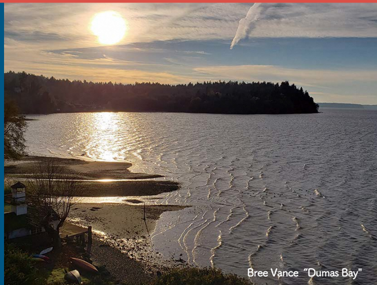
Bree Vance “Dumas Bay”