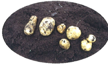
おもしろい形のいもたち