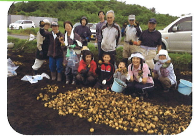
みんなでいもを持って とったどー！