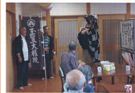
屋敷持弓神楽 歯打ち

歯打ち式終了後、町内にある小規模多機能ホーム「サンシャイン」を訪問し、通所者・スタッフの方々の無病息災を祈願して歯打ちを行いました。