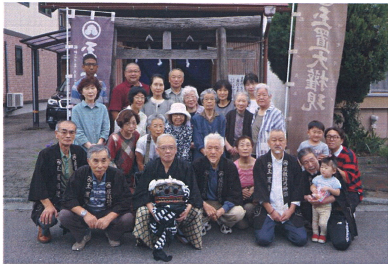
屋敷持弓神楽歯打ち式の集合写真(平成30年9月8日お堂前)