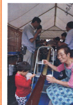
「ソーメン、取ってあげたよ。もっと食べる？」