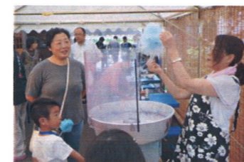
白に青を混ぜるとこんな色

今年で3回目となる地域交流祭には、町内から24名の大人、子どもの参加があり、皆さん楽しみました。