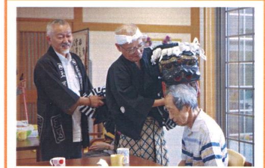
屋敷持弓神楽 頭を噛む