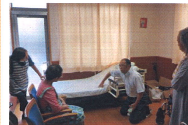
最初に腰の位置、次に枕の位置

交流祭では、「バーベキュー、イワシ焼、焼きそば、豚汁、おにぎり」の他、昔懐かしの「へちよこ団子」も登場。子ども向けの「ヨーヨー釣り、綿あめ、アイス」も。なんと流しソーメンは大好評で盛り上がりました。