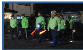
◆ 防犯パトロール ◆