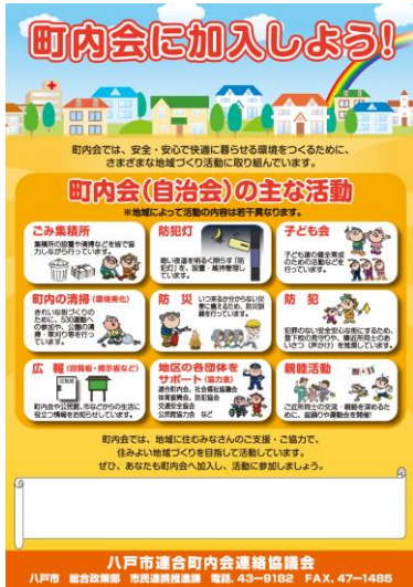
チラシ (A4 サイズ)