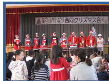
◆ 子ども会クリスマス会 ◆