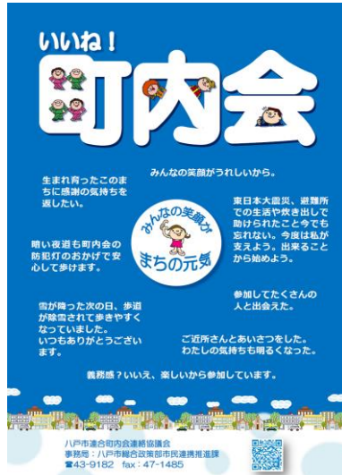
ポスター (A2 サイズ)