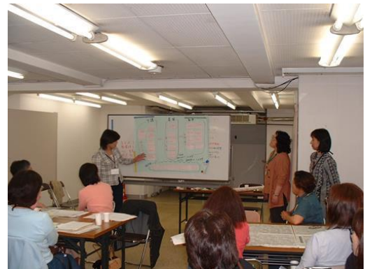
グループワーク・意見発表