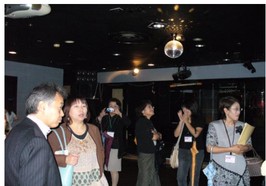
市長と繁華街視察