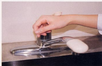
7. 水道の栓を止めるときは、手首か肘で止める。できないときは、ペーパータオルを使用して止める