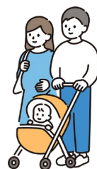
仕事と家庭の両立