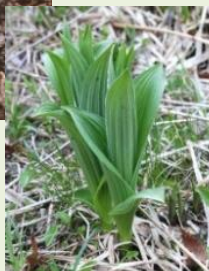
芽出し期 のコバイケイソウ