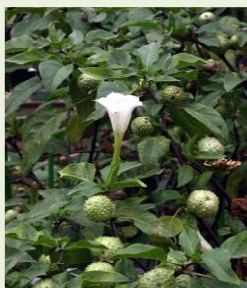
チョウセンアサガオの葉と花