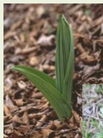
芽出し期 のバイケイソウ