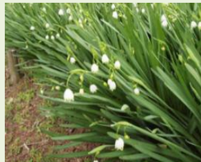
スノーフレーク (スズランスイセン)