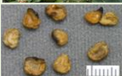
チョウセンアサガオの種