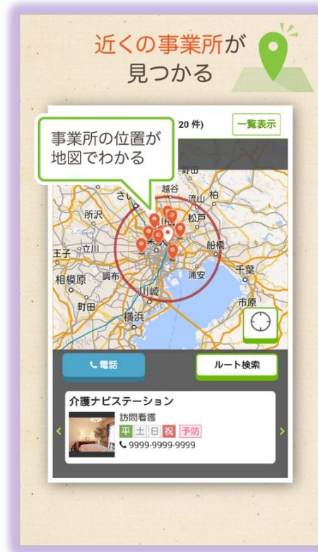
現在地からの距離や道順が分かる