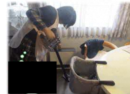
家事支援のイメージ