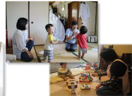
育児支援のイメージ