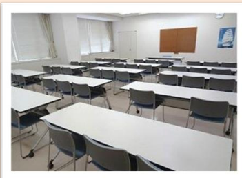
《小研修室》 収容人数：最大46名