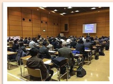
《大研修室》 収容人数：最大250名

※児童・生徒（小学生～高校生）のみにはお貸しできません。大人の参加が必要となります。ご了承下さい。