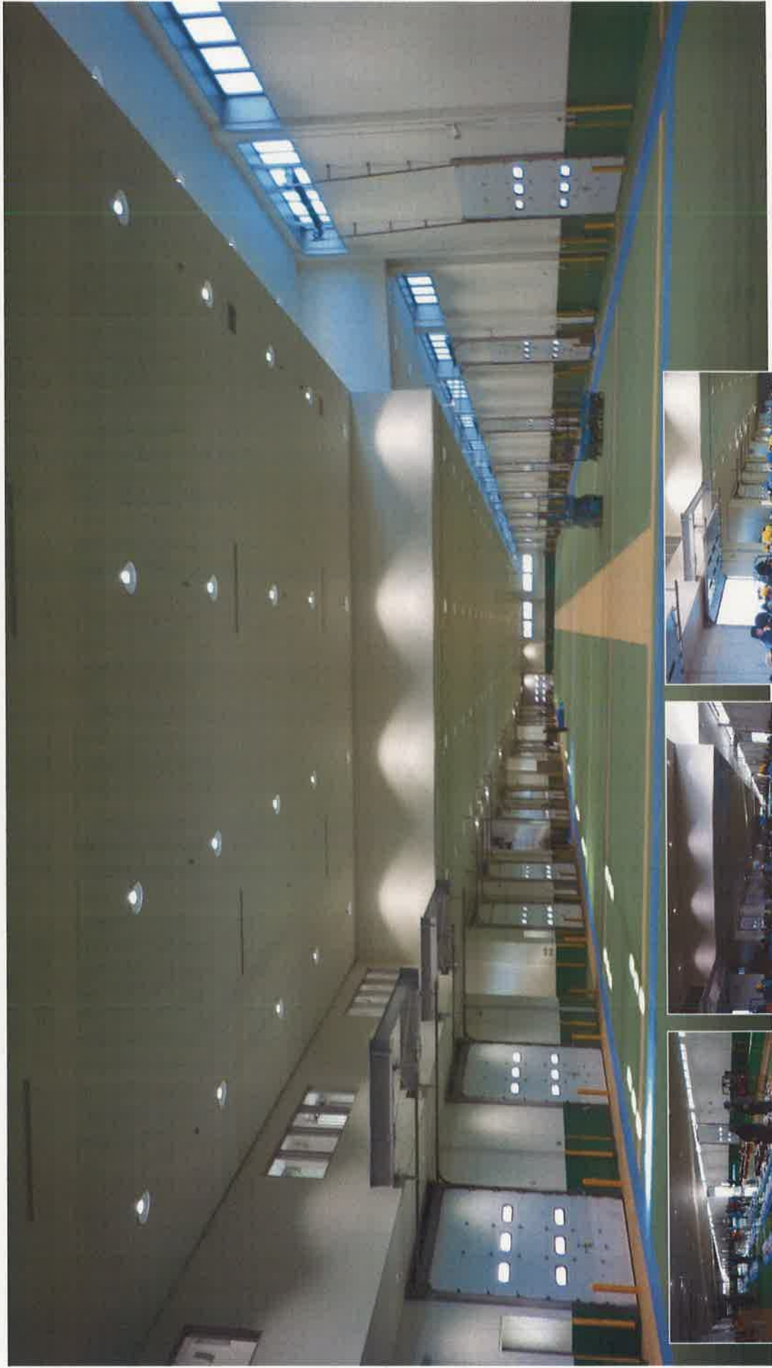
荷さばき室 (L=185.5m W=26.0m)